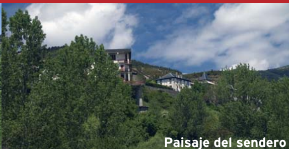
Paisaje del sendero