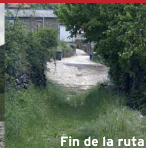
Fin de la ruta

N UESTRA RUTA COMIENZA EN LA LOCALIDAD DE ARAGÜES, que recomendamos visitar antes de iniciar la ruta, en el llamado popularmente " Carrerón ", una empinada escalera que nos conducirá hasta el inicio del sendero de tierra.